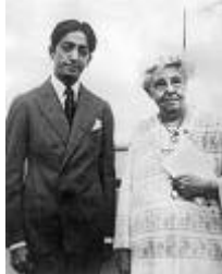
Krishnamurti con Annie Besant de la Sociedad Teosófica