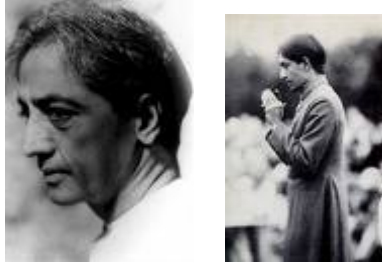
Krishnamurti disolviendo la Orden de la Estrella

enseñanza estaba la comprensión de que los cambios fundamentales de la sociedad podían tener lugar sólo con la transformación de la conciencia individual . Se acentuaba constantemente la necesidad del conocimiento propio , así como la inteligente captación de las influencias restrictivas y separativas originadas en los condicionamientos religiosos y nacionalistas. Krishnamurti señalaba siempre la urgente necesidad de una apertura para ese “vasto espacio del cerebro que contiene en sí una energía inimaginable”. Ésta parece haber sido la fuente de su propia creatividad y la clave para el impacto catalizador que ejerció sobre tan amplia variedad de personas.